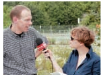
Radiointerview mit «Mr. Biber» anlässlich der Medienorientierung Mitte Juli.